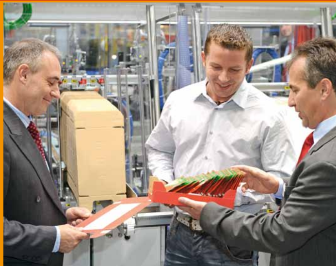
Tak vypadají znalosti

Těšte se na veletrh obalený příjemnou atmosférou a šarmem města Norimberku. Svěží mix spojující historické císařské město a pulzující metropolitní region zve k delšímu pobytu, oddechu a užívání si. Naše osobní tipy a doporučení jsme pro Vás sestavili na fachpack.de/afterwork